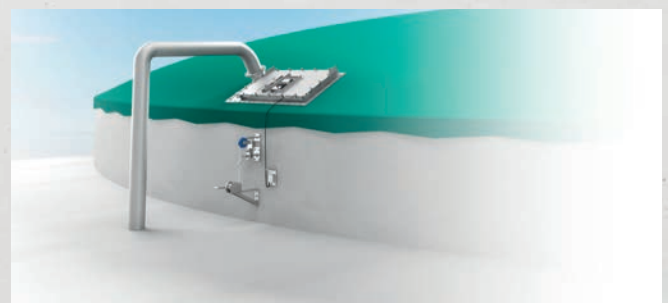
Illustration EGR 3 (avec ouverture de maintenance, vue de l'extérieur du conteneur)