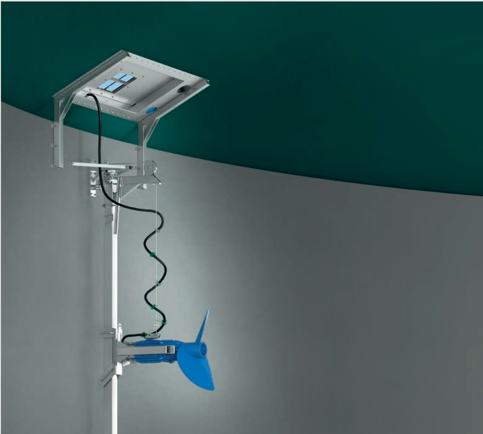
Illustration : EGR 3 avec GTWSI-EX 204